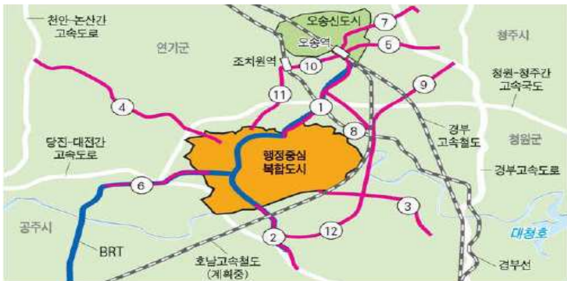
행정중심복합도시 연계 도로 12개 노선