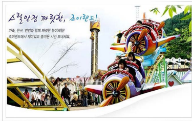
| Joy Land |