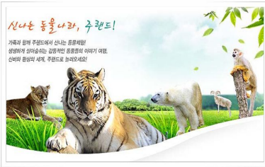
| Zoo Land |