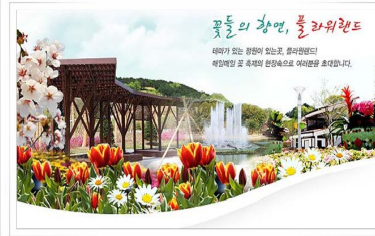
| Flower Land |