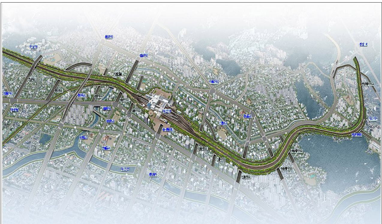
경부고속철도변 정비사업 현황도

자) 경부고속철도변 정비사업, 대덕테크노밸리 진입로 개설, 유등천 좌안도로 건설 / 당면·현안사항에서 보고