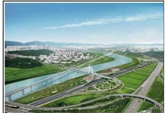
<대덕테크노밸리 진입로 개설>