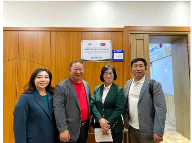
국립 우디르들라진아카데미 컴퓨터실 입구