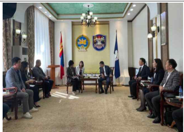
대전시의회(교육위원회)-울란바토르 시의회(인간 개발 위원회) 면담