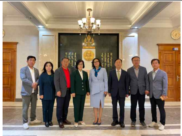
국립 우디르들라진아카데미 로비