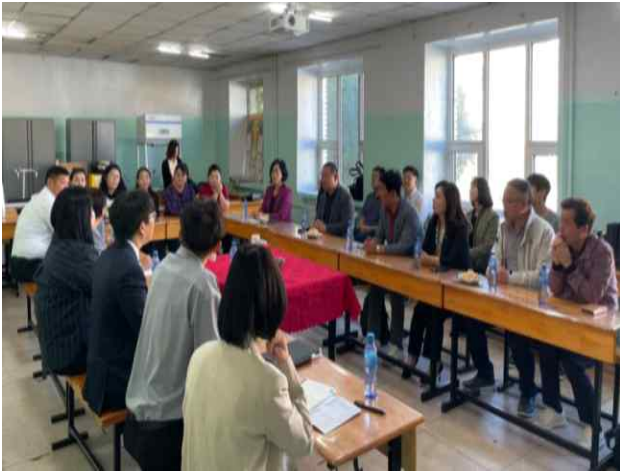
학교 의견 청취