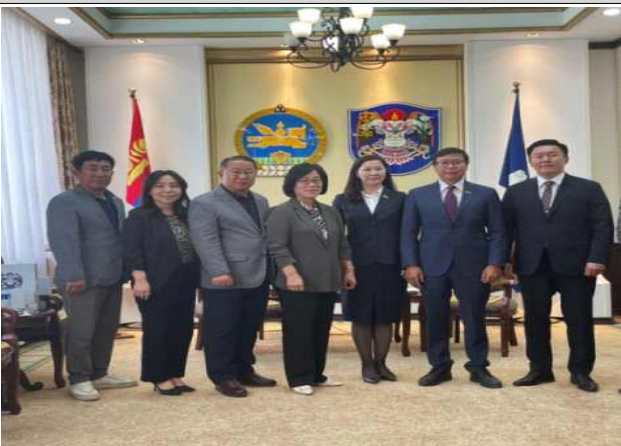
대전시의회(교육위원회)-울란바토르 시의회(인간 개발 위원회) 의원