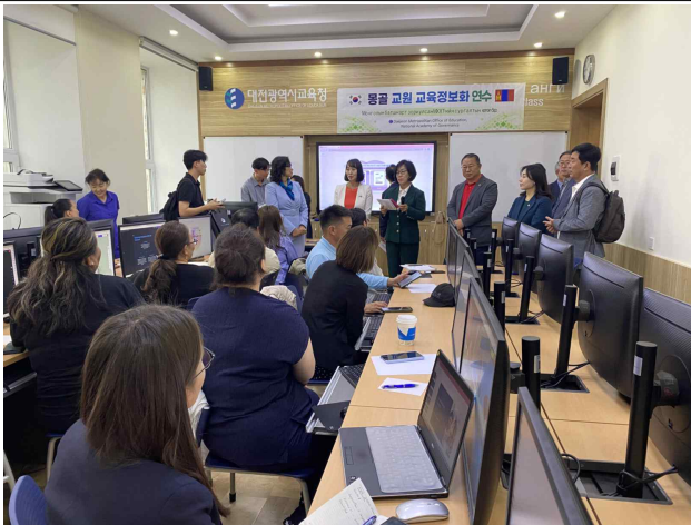
몽골 교원 교육정보화 연수 격려