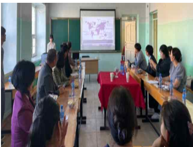
첨단교실 사업 소개