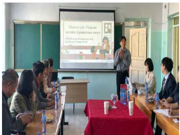
첨단교실 및 연수 설계안 설명