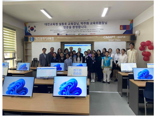
컴퓨터실 수업 시연 참관