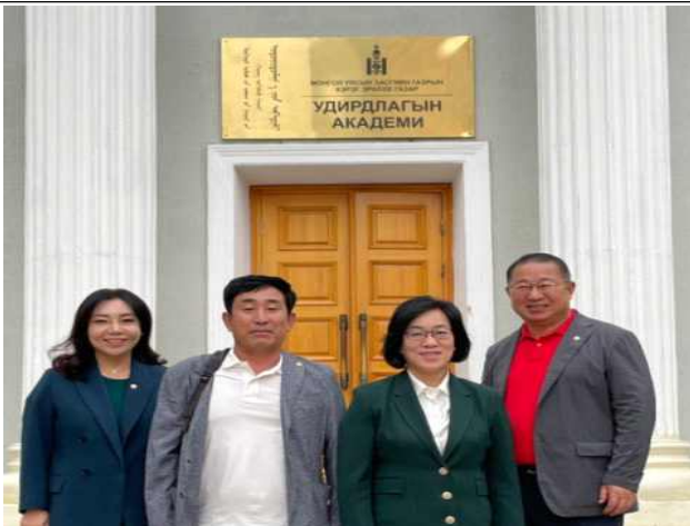
국립 우디르들라진아카데미 정문