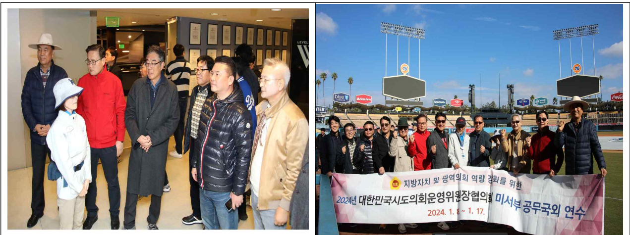
< LA다저스 경기장 >