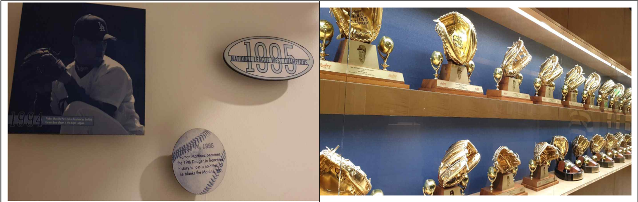
< LA다저스 역사의 공간 >