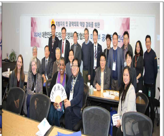
< 기념품 증정 및 기념 촬영 >