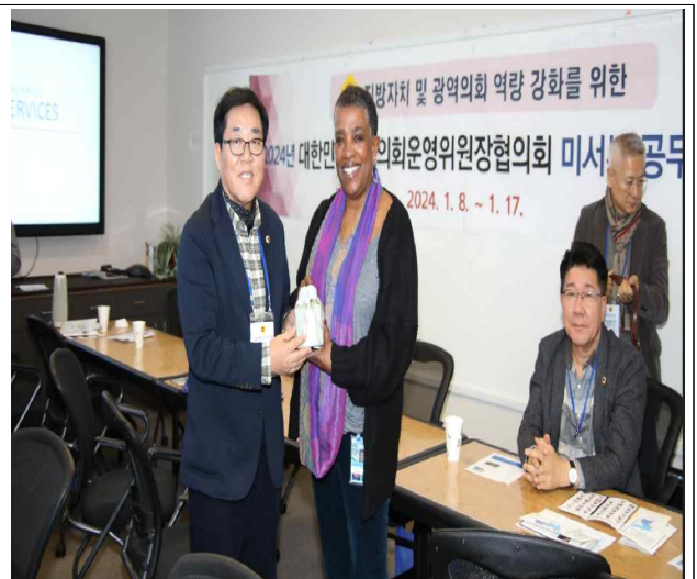
< 질의답변 및 기념품 증정 >