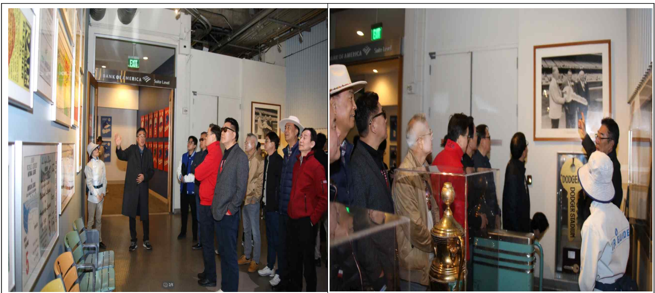
< LA다저스 역사의 공간 >